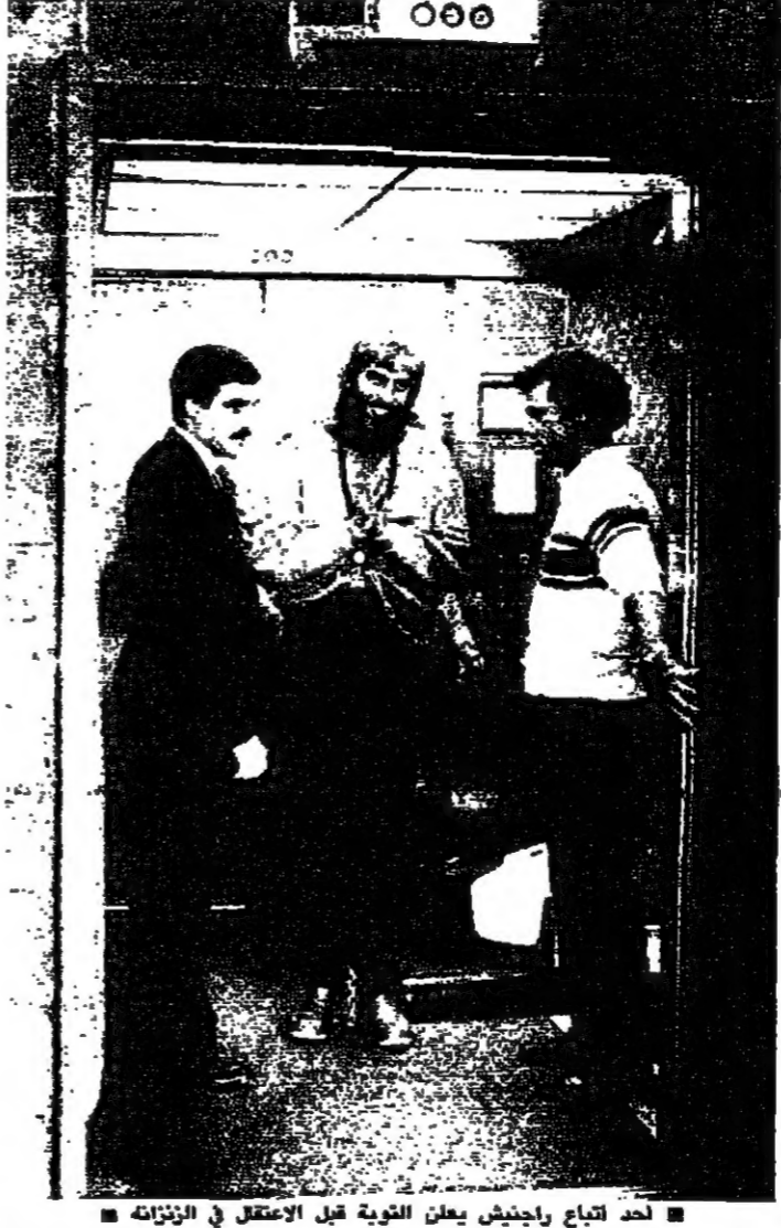
احد اتباع راجينش يعلن التوبة قبل الاعتقال في الرئزانه

الزعيم الروحي الهندي باجوان شري راجينش وصل الى نيويورك بعد الطوع الذي وضعه وجه لوجه مع القضاء الاميركي. ولدى وصوله الى العاصمة الهندية قتل راجينش وهو من كبار الداعين الى حرية الجنس. ان الولايات المتحدة بلد بغيض. في ما الهند بلد جميل... وهذا شعر بالراحة والغبطة. الاذن ان باجوان شري راجينش (٥٢ عاماً) والذي واكبته حاشية كبيرة وطبيب. اجتاز بلا عوائق. حواجز ادارات الهجرة والجمارك التي لم تفتح حافته وصنفاه وثقله. ولم يدل بآية ايضاح حول مشاريعه المستقبلية. كما انه رفض التعليق على احتمال توليه سلطات طائفته التي تعان ان عدد اعضائها يصل الى نحو ٥٠٠ الف عضو في العالم. ومن المتوقع ان يخوض معركة حامية مع مصلحة الضرائب الهندية التي تطالبه بتسديد مبالغ مستحقة. في حدود ١٧ مليون دولار. وفي عودة الى الورد، تشير ان الزعيم الروحي باجوان شري راجينش حكم عليه بالسجن (مع وقف التنفيذ) لمدة ١٠ سنوات لانتهائه القوانين الاميركية. وكان قد وصل الى الولايات المتحدة في العام ١٩٨١. واعطيت له مهلة لمدة خمسة ايام لتزكيا. حيث تعرض لعقوبة بالسجن لمدة ١٧٥ يوماً لقائه بقدر زيجات وهمية بين اعضاء اميركيين من طائفته واتباع اجانب لكي يستطيعوا البقاء في الاراضي الاميركية. المختر ان الزعيم الروحي ترك وراءه ٩٣ سيارة و١٥٠٠ رولز رويس يعزّم اتباعه يبعثا لكي يتمكنوا من الاستمرار في الحياة. في طائفة راجينشديورام في ولاية اوريفون. بقي ان تشير ان باجوان شري راجينش سوف يقصد منتجعات خاصة في الهند للاقبال من امراض في الكلى تؤرقه. ويتخصص الجيش على طريقة القراء والمهرجات الهندية. على الرغم من انه ترك لزوجته طائفة في الولايات المتحدة تقدر بملايين الدولارات. وهذا جزء من الروحانية التي يركز بها مع جماعة راجينشديورام.